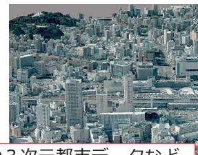
ハザードマップや3次元都市データなど