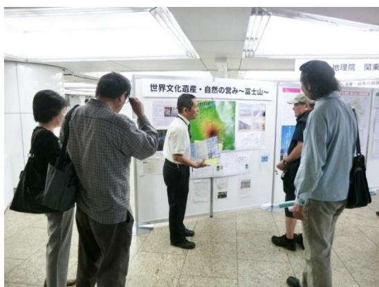
関東地方測量部の展示

富士山周辺の地形図や火山土地条件図など富士山の火山活動に関するパネルや、関東南部の伊能大図と江戸府内図を床展示して測量や地図に理解を深めてもらうような展示としました。来場者からは、「馴染み深い富士山だが地質・地形の点からみると興味深い」「伊能図がおもしろい」「仕事で使えるヒントがあった(中学校社会科教師の方から)」といった感想が寄せられました。