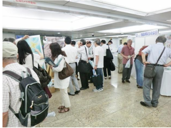
(一社)地図調製技術協会の展示