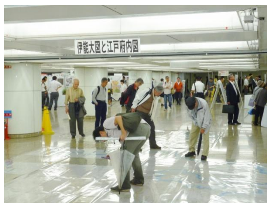
伊能大図と江戸府内図