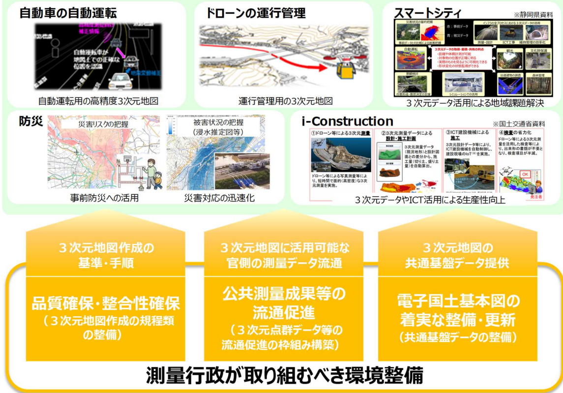
図4. 3次元地図の適切な整備と活用促進のために 測量行政が取り組むべき環境整備