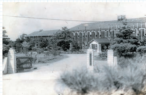
地理調査所(千葉県千葉市)