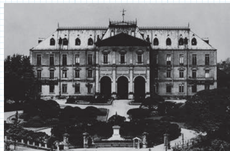
陸地測量部(東京市麹町区(通称 三宅坂))