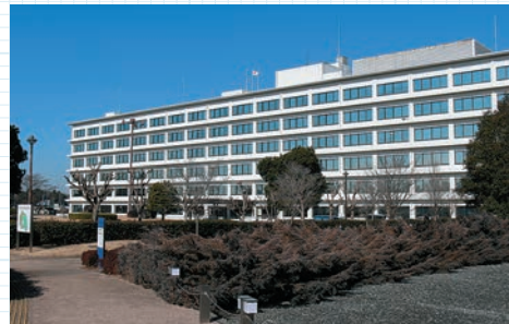
国土地理院本院(茨城県つくば市)