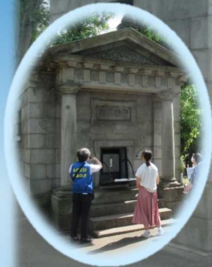
標庫内に格納されている 水晶目盛板の公開