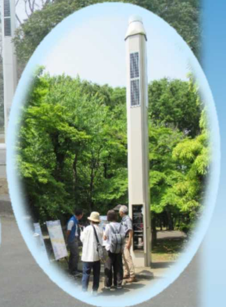
電子基準点 「東京千代田」の紹介