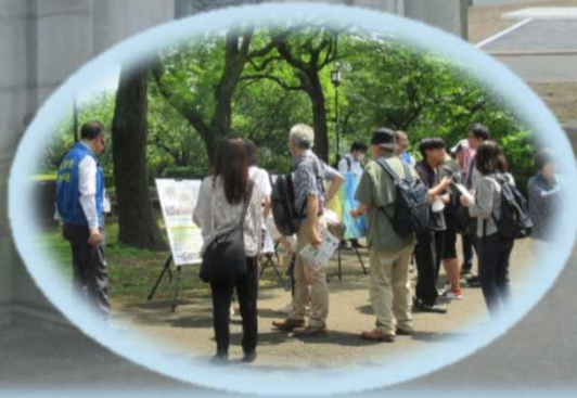
パネル展示・職員による説明