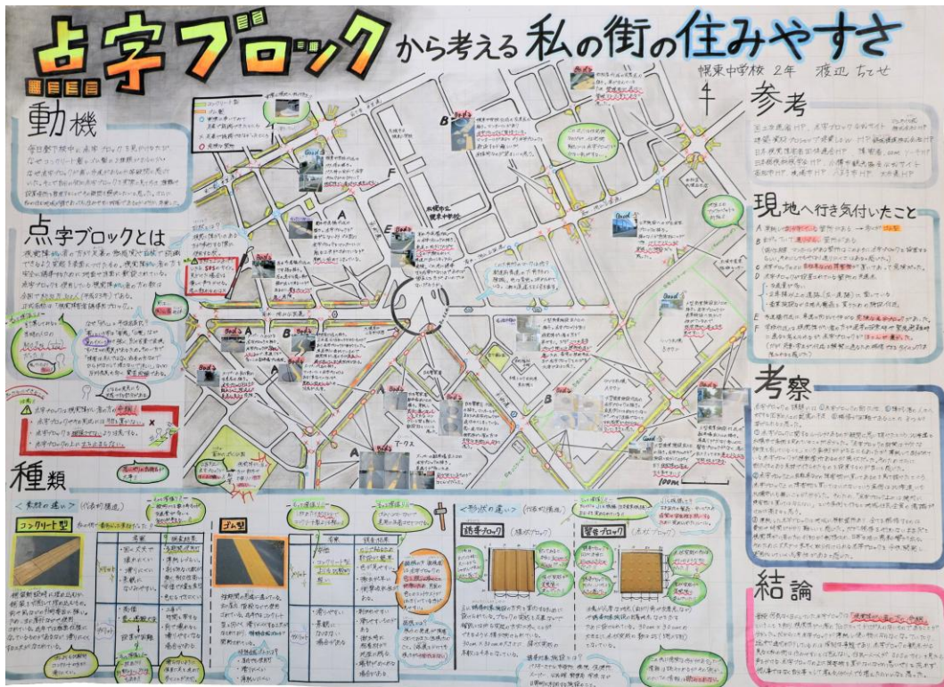
国土交通大臣賞受賞作品「点字ブロックから考える私の街の住みやすさ」