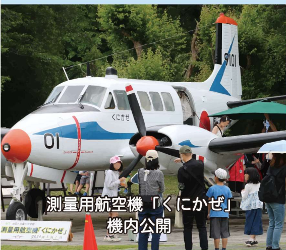
測量用航空機「くにかぜ」 機内公開