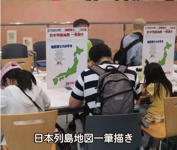
日本列島地図一筆描き