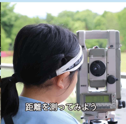
距離を測ってみよう