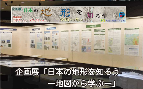
企画展「日本の地形を知ろう」 —地図から学ぶ—