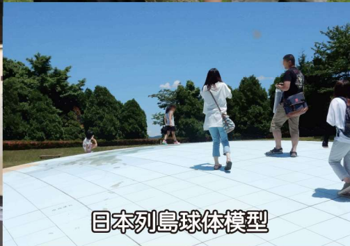
日本列島球体模型