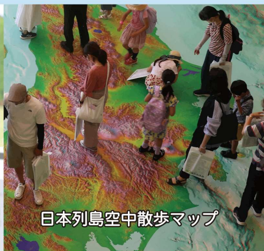
日本列島空中散歩マップ