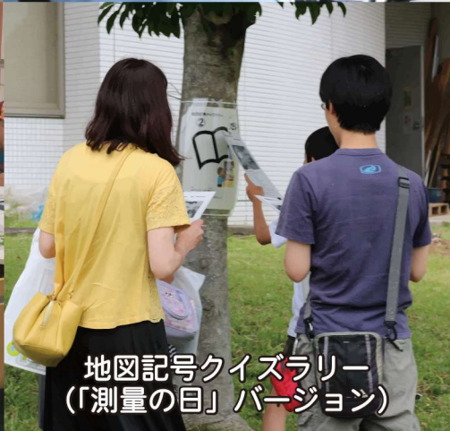
地図記号クイズラリー （「測量の日」バージョン）