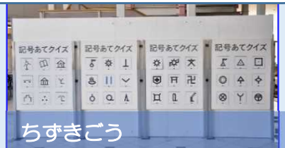
ちずきごう 地図記号あてクイズ

3 もしか ちず つか 文字の代わりに地図で使う ちずきごう 地図記号。いくつわかるかな？ ようし みぎ ※④の用紙はパネルの右にあります。