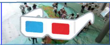
くうちゅうさんぽ 空中散歩マップ

1 あかあお 赤青メガネをつかって、 スリーディー にほんちず 3Dの日本地図を ガリバー気分で散歩しよう！