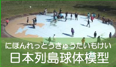
にほんれつとうきゅうたいもけい 日本列島球体模型

5 のぼるとちきゅう まる 地球の丸さと せいさく しま いち 正確な島の位置がわかるよ。 にほん いちばんひがし さいとうたん 日本の一番東(最東端)に あるしま ある島はどれかな？