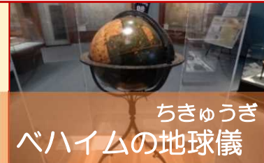
ちきゅうぎ ベハイムの地球儀

8 500年以上前につくられた せかいいちふる ちきゅうぎ なか か 世界一古い地球儀の中に描かれた にほん み 日本を見つかけよう！ ヒント：オリент もじ “ORIENTO”の文字