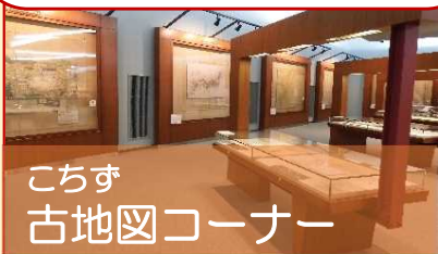
こちず 古地図コーナー

7 ふる ちず 古い地図がいっぱい。 なんねんまえ 何年前のものがあるかな？ だれがつくったのかな？ いのうただたか し 伊能忠敬って知ってる？