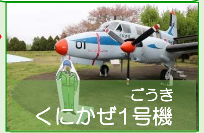
ごうき くにかぜ1号機

6 そらから しゃしん と 空から写真を撮るために つかっていたさいしょの飛行機だよ。 カメラのレンズはどこかな？