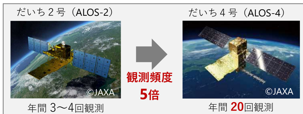
図2. だいち2号 (ALOS-2) とだいち4号 (ALOS-4) の観測頻度

国土地理院では、「だいち2号」の観測データに加え、「だいち4号」の多量の観測データを用いた干渉SAR時系列解析を実施するための準備を進めています。