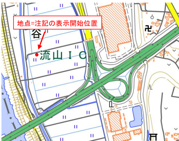
文字グループ付与前