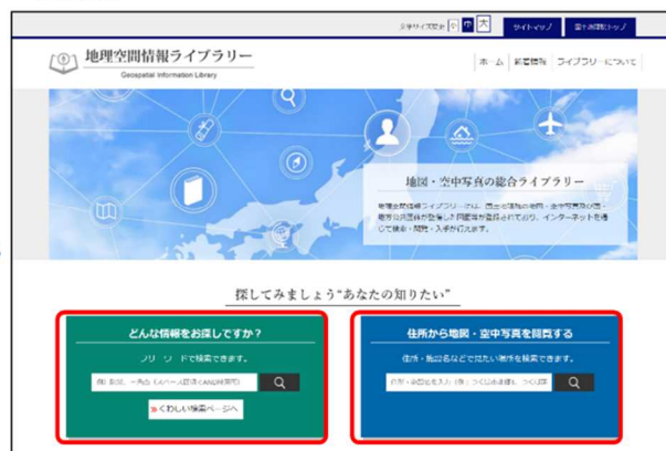
図-1 コンテンツ検索機能と住所検索機能のレイアウト（改良前後）