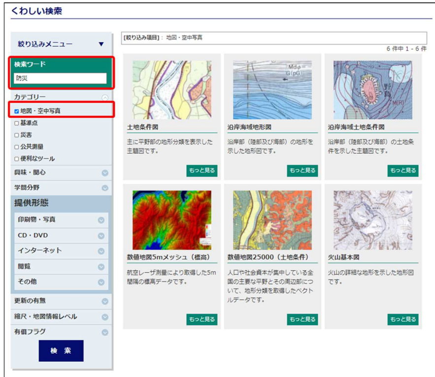
図-3 フリーワード検索と絞り込みメニューの同時実行画面