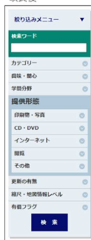
図-2 絞り込みメニューの分類（改良前後）