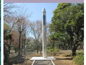
電子基準点「東京千代田」