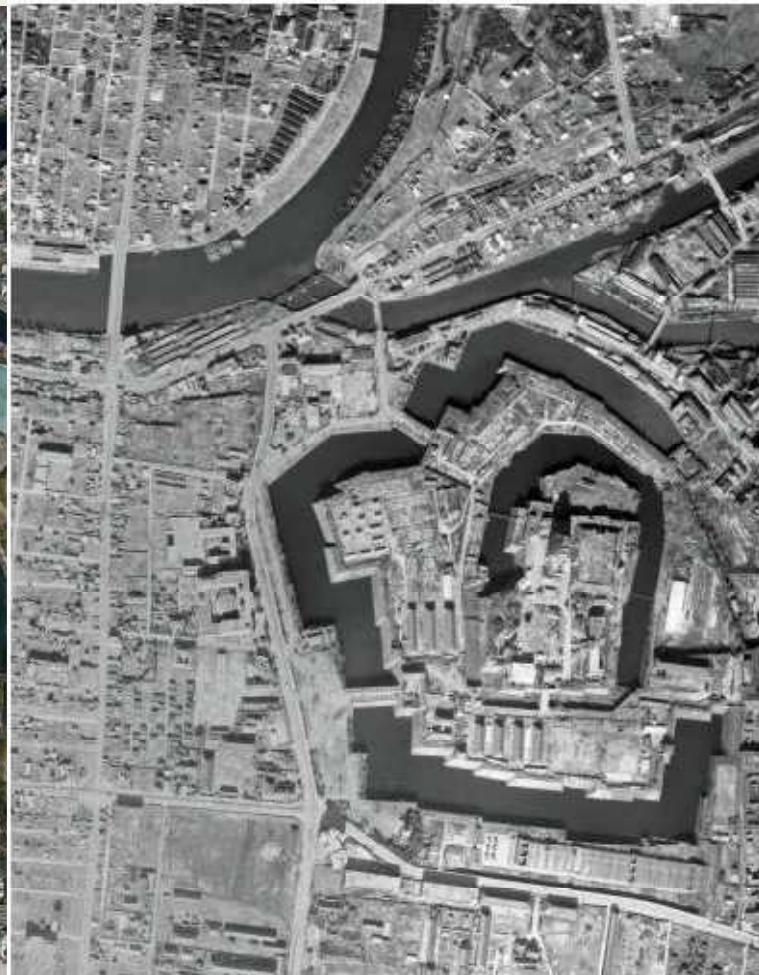
昭和23年12月30日 米軍撮影