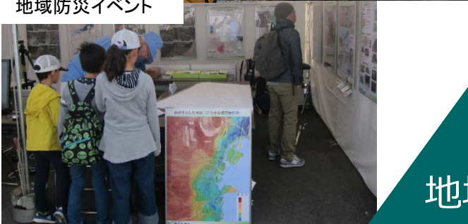
地域防災イベント