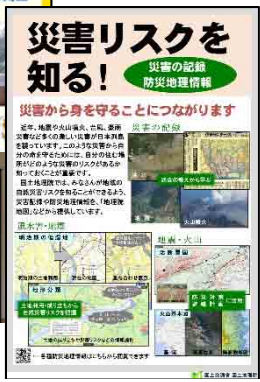
災害リスクを知る! 災害の記録 防災地理情報