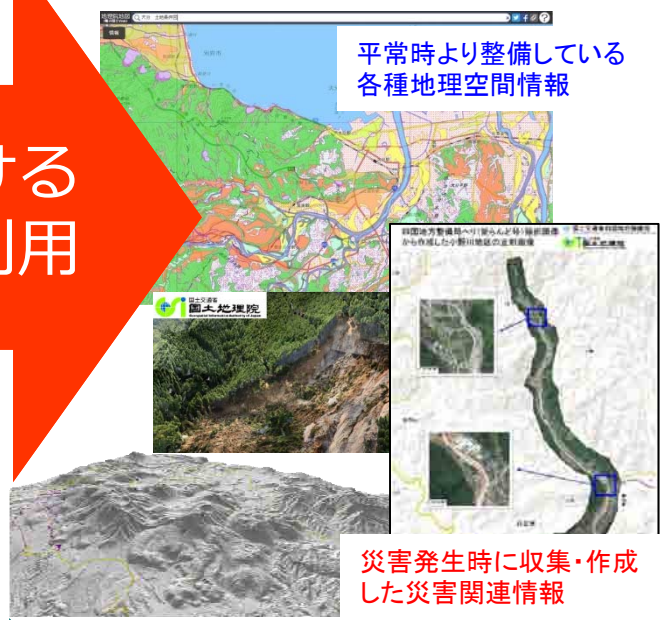
平常時より整備している各種地理空間情報