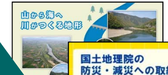
山から海へ川がつくる地形