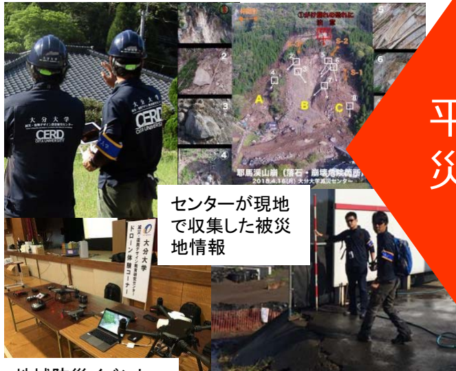
センターが現地で収集した被災地情報

※本資料は連携・協力の一例を紹介する ものです。写真・画像はイメージとなります。