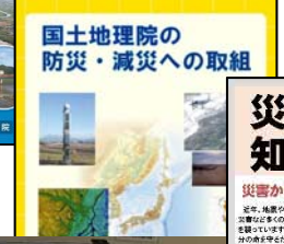
国土地理院の防災・減災への取組