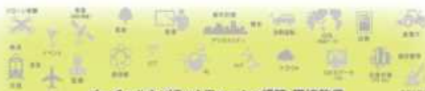
バーチャルなプラットフォームの構築・環境整備

最終的には全道のVRモデル、プラットフォームを整備し、様々な産業分野で利用できるように構築することを目標とする。