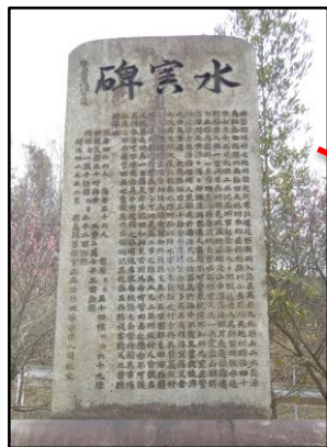
自然災害伝承碑 (水害碑：広島県坂町)