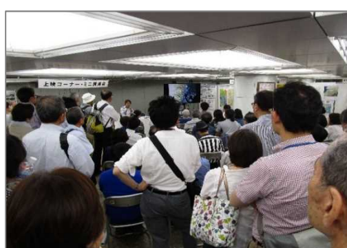
ミニ講演会の様子