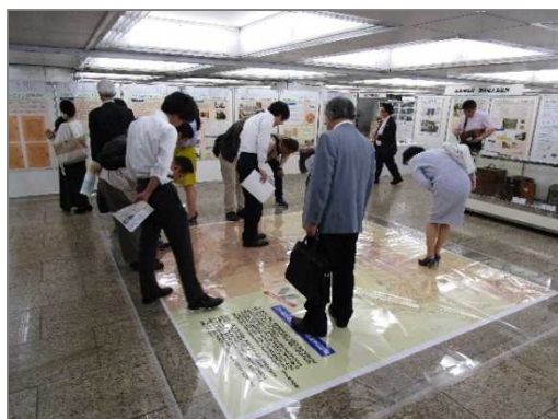
明治初期に作成した彩色地図の床展示

今回も、実行委員会の団体から地理に精通した方を講師として地図に関するミニ講演会(3日間で合計11回)を実施しました。展示内容を紹介したミニ講演会を開くことで、客層の幅を広げるとともに、展示内容により深い興味を持って見学頂けることができました。