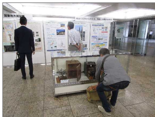
測量器機の実物展示