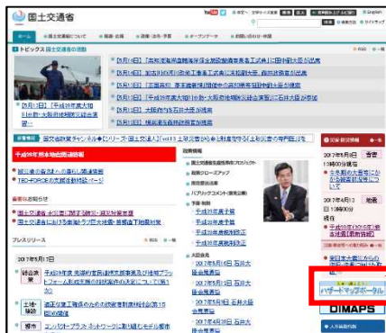
国土交通省トップページから アクセスできるようにしました。

※ハザードマップポータルサイト…災害時の避難や、事前の防災対策など様々な防災に役立つ情報を提供 パンフレットはこちら http://disaportal.gsi.go.jp/hazardmap/pamphlet/pamphlet.pdf