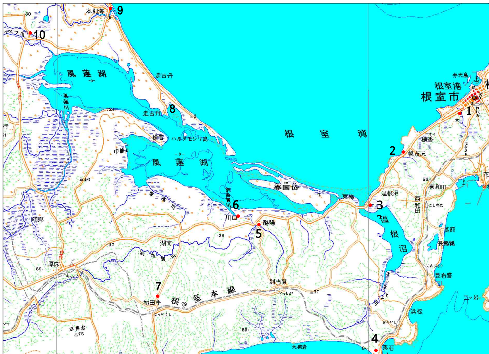
図 - 1 ボーリング位置図