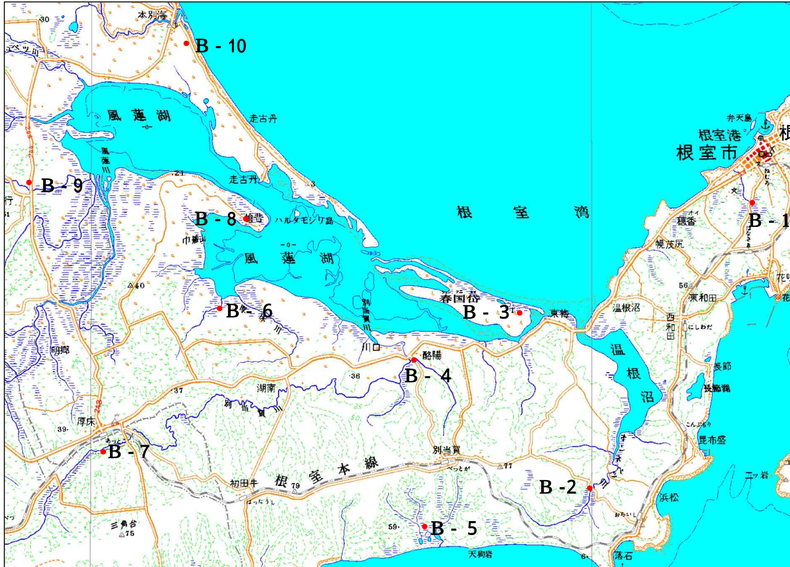
図 - 3 簡易ポーリング位置図