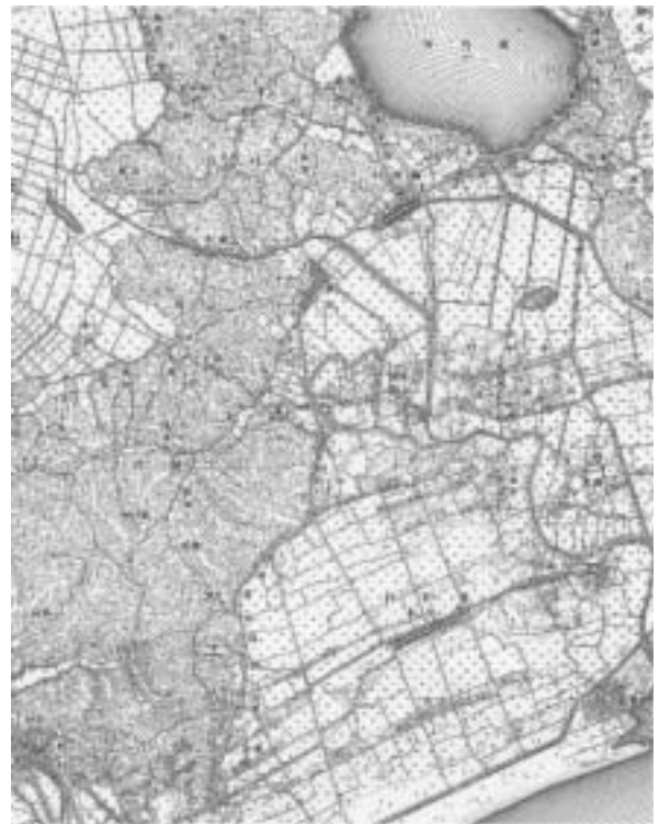
図-8 5万分1地形図「松嶋」の一部(縮小)