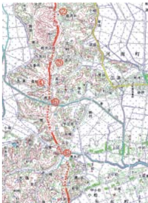
図一六 旭山撓曲と調査地点図 (②～⑥)

側のプレート内部の地震ではなく、陸側のプレート内部の地震であるとされた。余震の震源分布から旭山撓曲が活動した可能性のあることが指摘された。そこで、旭山撓曲を横断する道路の亀裂を中心に、旭山撓曲の活動の有無について調査を行った。