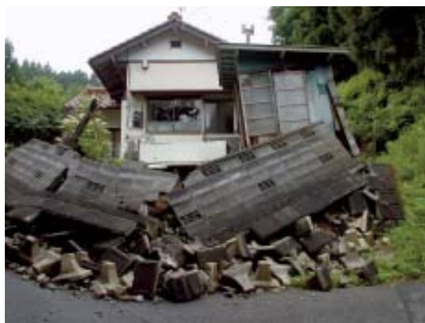
写真一四 旭山撓曲に近い盛り土・家屋の崩壊 (図一六、地点③)

河南町表沢および久米田では旭山撓曲は峠付近を通っている。旭山撓曲を横切る道路に亀裂等はみられなかった。しかし、道路沿いの擁壁の継ぎ目が開口し、砂が流出しているところがあった。その東側、表沢方面にはこの道路の左手に少し下ったところに脇道がある。その道を横切って幅数cm(最大15cm)の開口した亀裂が3本あり、その先、道が北方へ曲がったところに崩壊があった。道路と盛り土のブロック積み擁壁、その上のブロッ