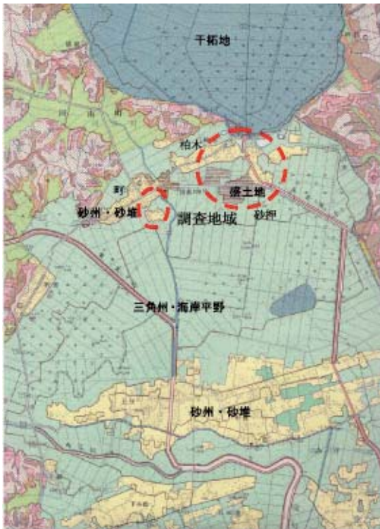
図-7 土地条件図「松嶋」の一部(縮小)