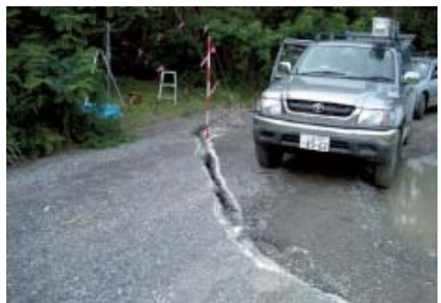
写真-6 三等三角点「浜市」

今回実施した改測作業は、短時間で効率的に多くの情報を得るため、同時観測するセッションにこだわらず、電子基準点を使用し2時間以上のデータを取得することに努めた。