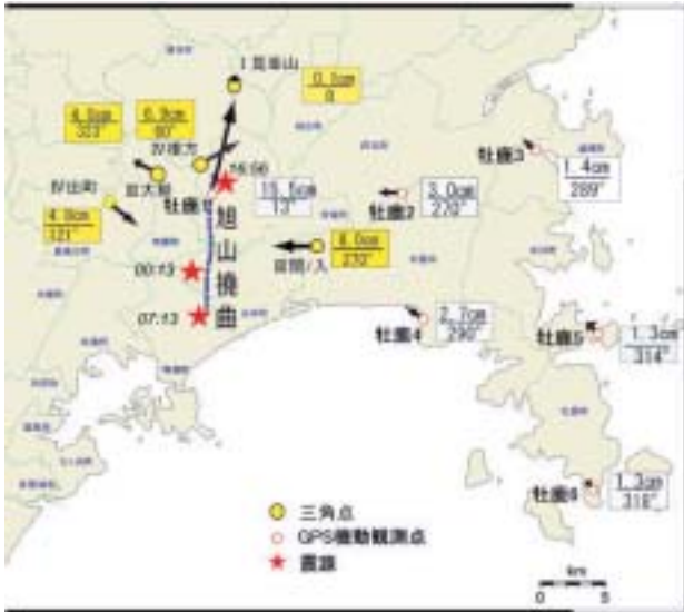
図-11 地殻変動観測点及び三角点の水平変動量

電子基準点の解析結果によると、牡鹿半島全体の大きな変動はなかったため、前回固定点扱いとした電子基準点「女川」を今回も固定点とした。図-11, 12からも判るように「牡鹿1」は水平で15.5cm、上下で16.5cmの変動が確認された。これは、電子基準点「矢本」での水平変動16.4cm、上下変動8.6cmと近い数値であるが、旭山撓曲の真上にあることから変動が大きくなったと推定される。