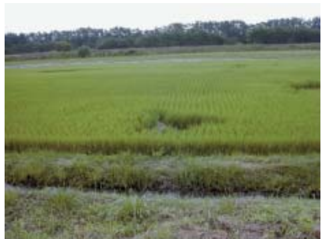
写真-5 液状化が確認された水田 三等三角点「浜市」近傍

図-10のNo. 7, 8, 9, 10は、旭山撓曲の南端部あり、家屋被害も多いところである。また、三等三角点「浜市」(No. 7)付近では、液状化も確認されていた(写真-5)。このため、この付近は観測点を集中的に配置した。