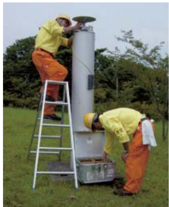
写真-4 地殻変動観測点「牡鹿1」

6点の地殻変動観測点は、高さ約2mのピラー構造であり、GPSアンテナを設置して観測を実施する（写真-4）。