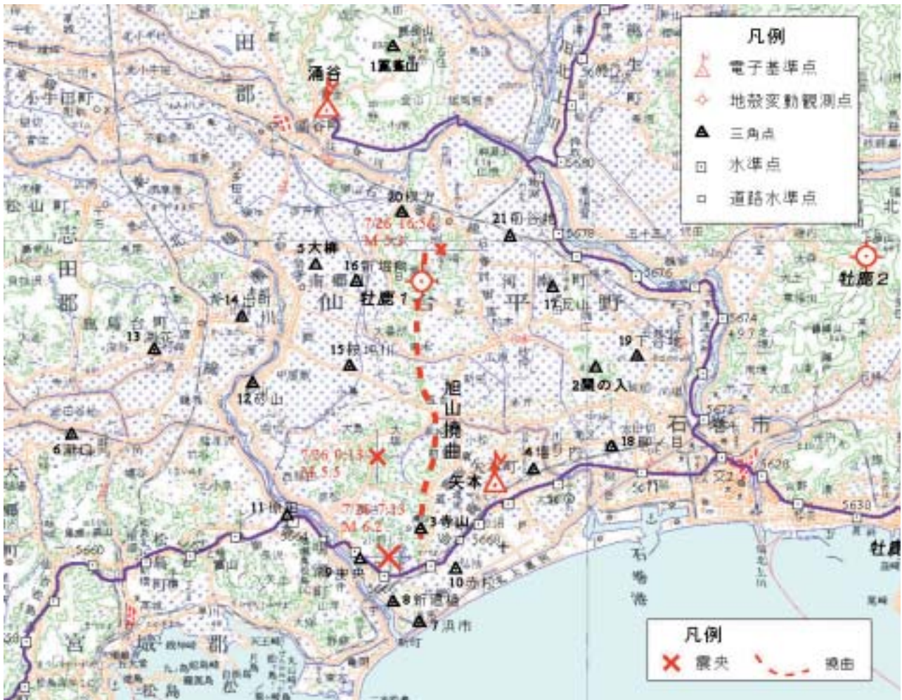
図-10 旭山撓曲と震源位置及び観測点位置図