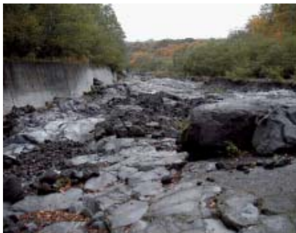
写真-1 西麓の大沢川 (標高 1,270m 付近、河床に大沢溶岩が広く露出している)

大規模な山頂噴火による噴出物である約 2200 年前頃の湯船第 2 スコリア (写真-2 赤丸の地層) を基準に、これより新しいもの (新期溶岩流) と古いもの (旧期溶岩流) とに分けて表示した。新富士火山の噴火史は、宮地 (1988) 及び宮地・小山 (2001) によると概ね次の表-1 のようにまとめられる。