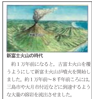
図-4 富士山のおいたち (富士砂防工事事務所, 2001)

新富士火山による噴出物は、現在の富士山山体の表層を厚く広く覆っているが、このうち溶岩流 (例えば、写真-1) については、これまでも多くの調査研究報告があるが、個々の溶岩流の分布や噴出した年代については、未だ多くが不明のままとなっている。