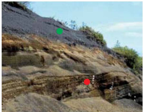
写真-2 崖に現れた富士山の噴出物 (緑丸の地層; 宝永スコリア、赤丸の地層; 湯船第 2 スコリア 御殿場口登山道“太郎坊”)