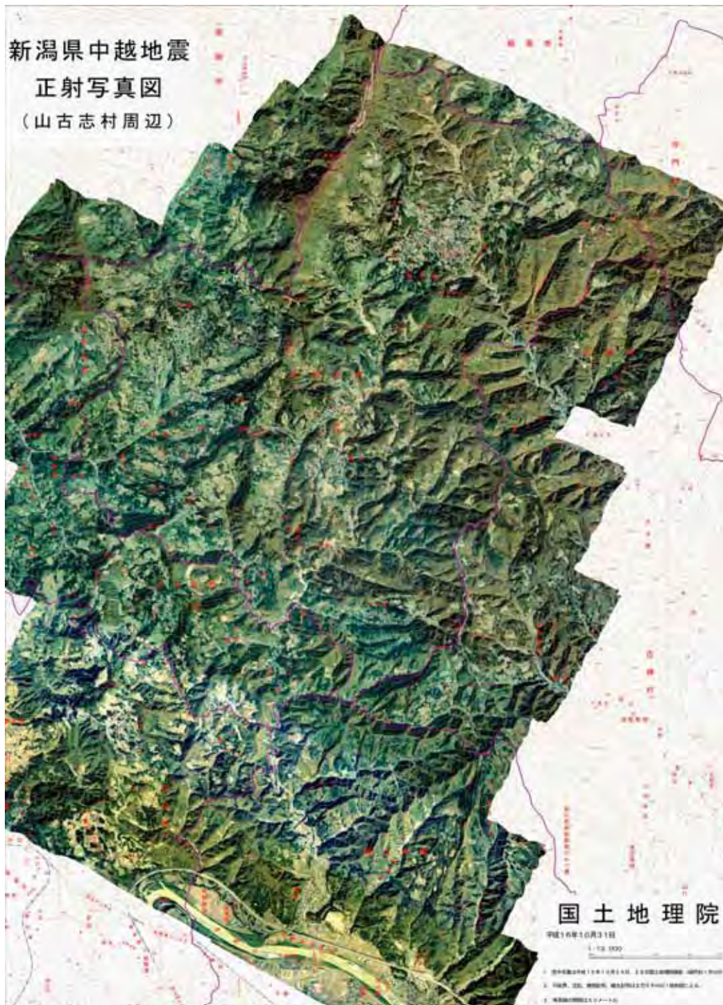
図-3 正射写真図 山古志村周辺 (A1判 1/13,000印刷図を縮小掲載)

10月24日、28日の両日に撮影された写真は、国土地理院到着後ただちに複製を行い、内閣府、国土交通本省、新潟県、市町村災害対策本部等の防災機関へ配布し、各種の災害対応に活用された。また、基本測量成果として速やかに本院及び関東地方測量部、北陸地方測量部で閲覧を行うとともに（財）日本地図センターより刊行を開始した。