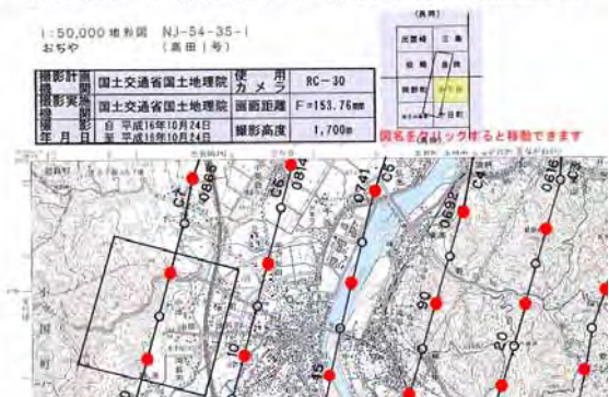
図-4 ホームページ用標定図画像（部分）