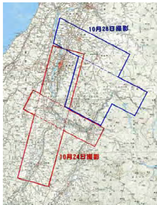
図-2 空中写真撮影区域図

地震発生の翌日24日は、好天に恵まれ予定地区12コース(662枚)の撮影(図-2)をほぼ計画どおり実施し、撮影後のフィルムは即座に現像・焼き付け作業が行われた。撮影された密着写真は、翌25日中に国土地理院(つくば市)へ到着した。