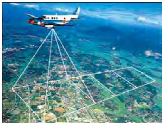
図-1 測量用航空機「くにかぜⅡ」

地震発生時、測量用航空機「くにかぜⅡ」(図-1)は、海上自衛隊下総航空基地において航空測量