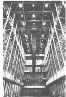
写真-29 リモートセンシング実験棟

測図部では、1973 年度に LANDSAT 衛星画像を用いた研究から始まり、筑波研究学園都市に移転してから本格的に始動した。筑波では専門施設としてリモートセンシング実験棟（写真-29）が設置され、クレーン、スクリーン、画像処理システム装置、野外赤外放射計、マルチスペクトルビューア、解析画像再生装置などが設置され、各種リモートセンシング観測ができるようになった。