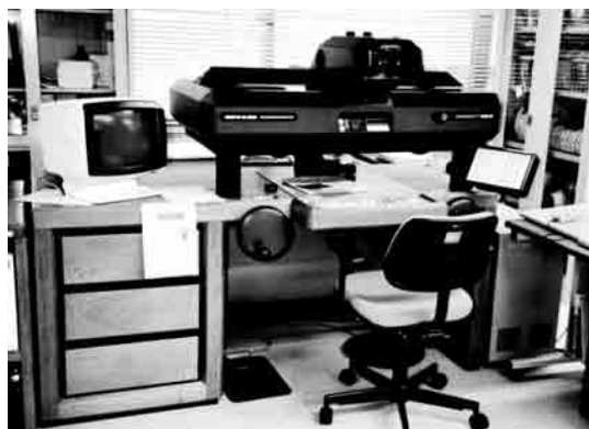
写真-28 解析図化機アビオリット BC 2

デジタルマッピング方式による国土基本図修正測量が実施されることになり、作業方法確立のため1990年から3ヵ年計画で研究作業を実施して、1994年に共同作成による八千代地区の修正が行われた。