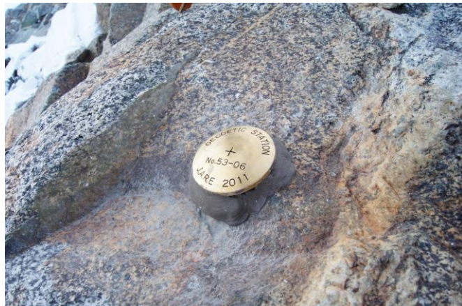
地上写真 Ground Photograph