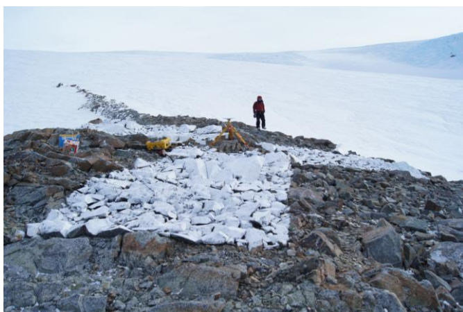
刺針写真 Pricking Photograph