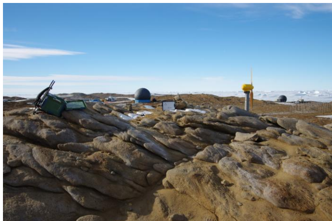
対空標識写真 Airphoto Signal Photograph