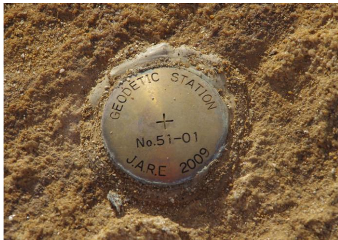
地上写真 Ground Photograph