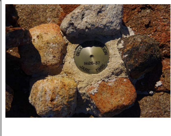
地上写真 Ground Photograph