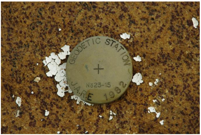
地上写真 Ground Photograph