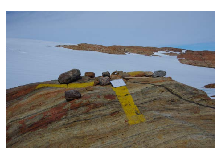
刺針写真 Pricking Photograph