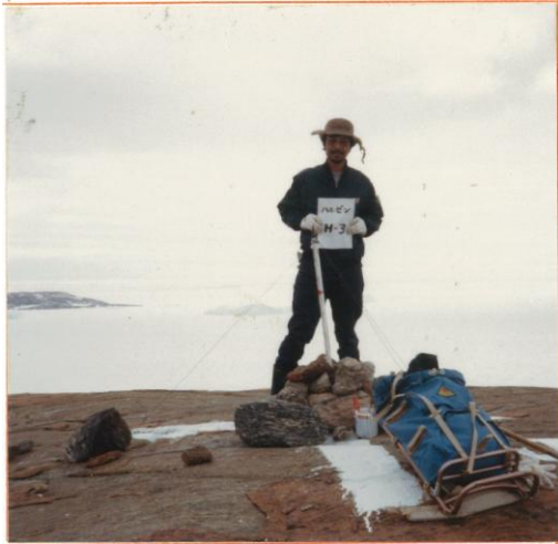
刺針写真 Pricking Photograph