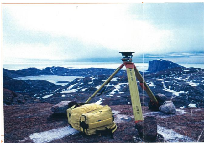
刺針写真 Pricking Photograph