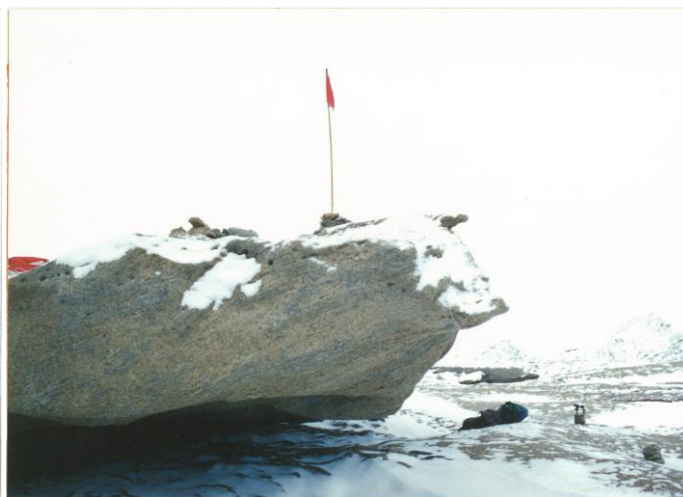
対空標識写真 Airphoto Signal Photograph