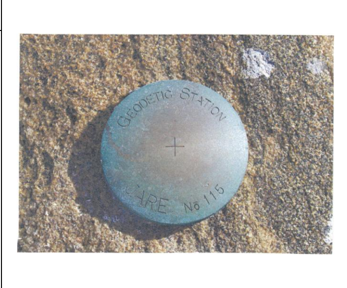
地上写真 Ground Photograph