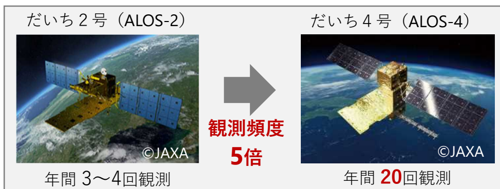
図2. だいち2号 (ALOS-2) とだいち4号 (ALOS-4) の観測頻度

国土地理院では、「だいち2号」の観測データに加え、「だいち4号」の多量の観測データを用いた干渉SAR時系列解析を実施するための準備を進めています。