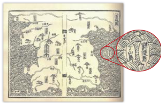
【図1】『新增東國輿地勝覽』 「八道總図」(1531年)