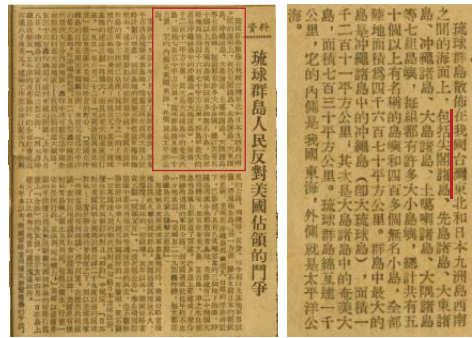
第4圖の記事に、「琉球諸島は尖閣諸島を含む7つの諸島からなる」という記載があります(1953年1月8日付)。