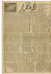
個人の寄贈による

1953年、中国共産党の機関紙である人民日報が発出した論説の中には、琉球諸島は尖閣諸島を含む7つの諸島からなる旨の記載があります。当時、中国共産党として、尖閣諸島は台湾の一部ではなく沖縄の一部であったと認識していたことを示しています。