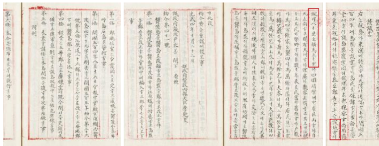
【図4】「鬱陵島を鬱島と改称し島監を郡守と改正することに関する請議書」(1900年)

むしろ、勅令第41号の制定に際し提出された「鬱陵島を鬱島と改称し島監を郡守と改正することに関する請議書」では、該(島)*地方は縦可八十里(※約32km)で横為五十里(※約20km)」としています。鬱陵島から約90km離れた竹島はこの範囲外にあり、「石島」が竹島ではないことが明確です。