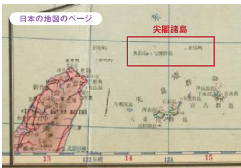
日本の地図のページ中に尖閣諸島を記載