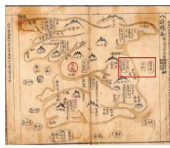
【図2】「八道總圖」(17世紀) 『朝鮮古地図図帳』より

『新增東國輿地勝覽』の「八道總図」(図1)など15世紀～17世紀の朝鮮の古地図の多くで「于山」は鬱陵島より西に描かれており、存在しない島です(竹島は鬱陵島の東側)。図2で紹介する「八道總図」では、「于山」が島を表す丸ではなく四角で囲まれており、地名として表現されています。