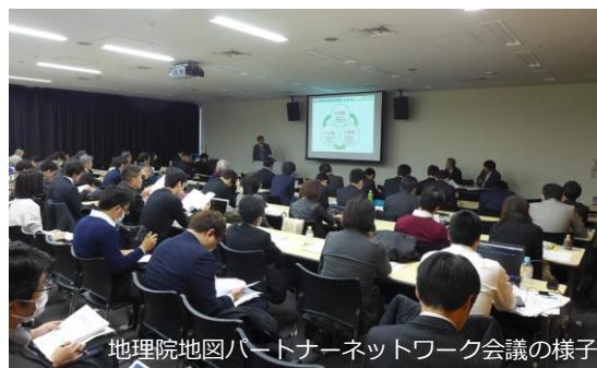
地理院地図パートナーネットワーク会議の様子