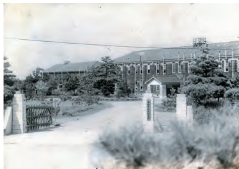
地理調査所(千葉県千葉市)