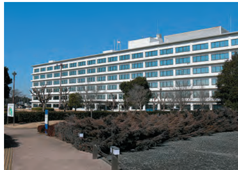
国土地理院本院(茨城県つくば市)