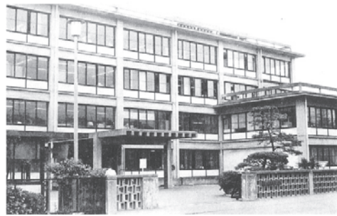
地理調査所(東京都目黒区)