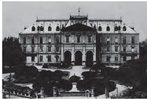
陸地測量部(東京三宅坂)