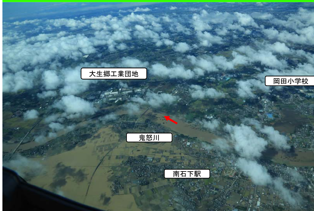
常総市上三坂の鬼怒川破堤地点。