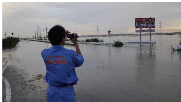
▲職員による現地確認