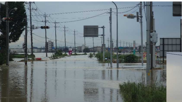
▲浸水による被災状況