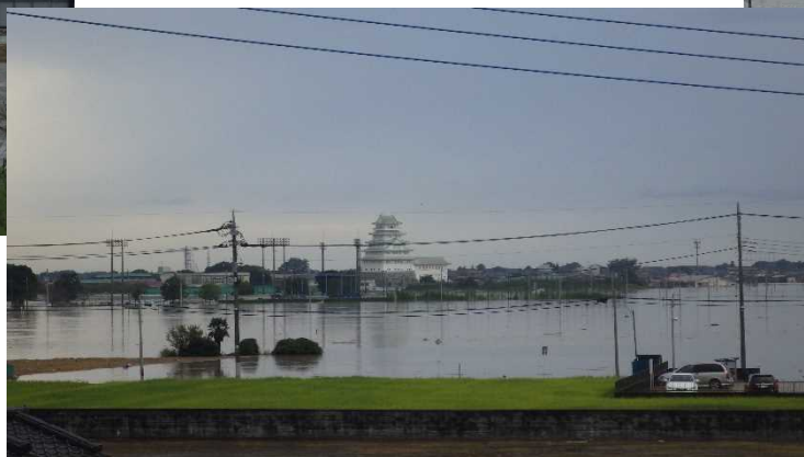
▲浸水による被災状況