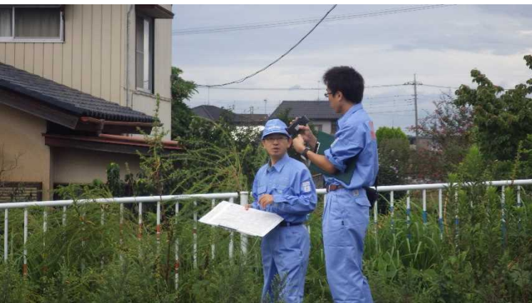
▲職員による現地確認