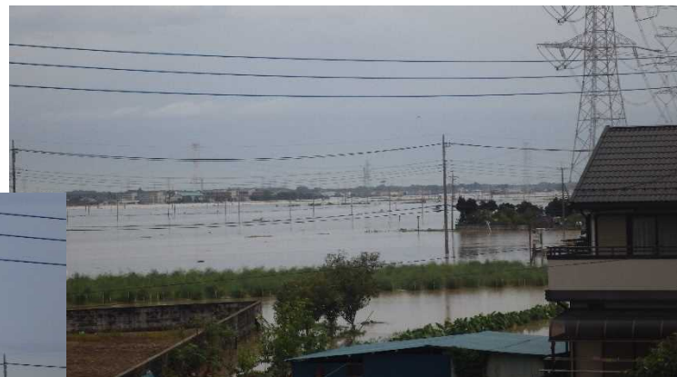
▲浸水による被災状況