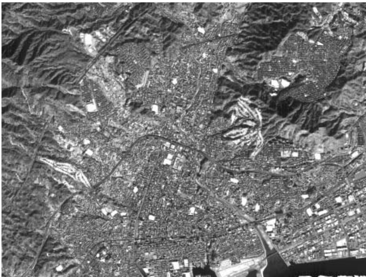
図-4 Eros-A1 ステレオペア画像から作成したオルソ画像 ISI_2001 Licensed by HEEIC