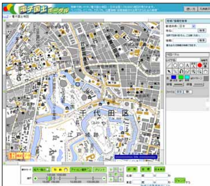
【電子国土ポータル ( http://cyberjapan.jp/ )】

本セミナーでは、「電子国土ウェブシステム」の仕組みや活用事例の紹介、実際にパソコンを使い電子国土ウェブシステムを活用しウェブサイトを作成する体験講習など、初心者の方にも分かりやすいプログラムをご用意しております。多くの皆様のご来場をお待ちしておりますので、是非ご参加ください。